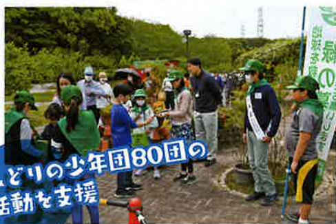
みどりの少年団80団の 活動を支援