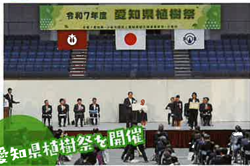
愛知県植樹祭を開催