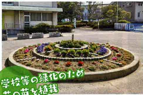
学校等の緑化のため 花の苗を植栽