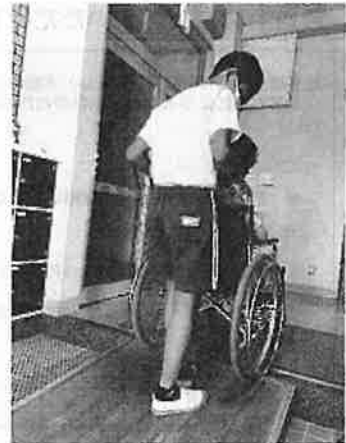
障がいを理解するための実践教室の様子