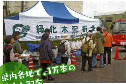
県内各地で、1万本の 苗木を配布