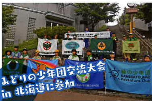
みどりの少年団交流大会 in 北海道に参加

2025年の緑の募金実績は、 85,166,665円 (前年比107%) でした