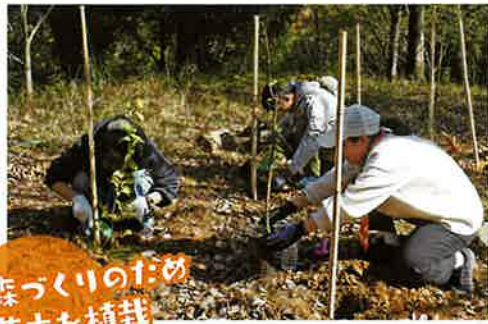
森づくりのため 苗木を植栽